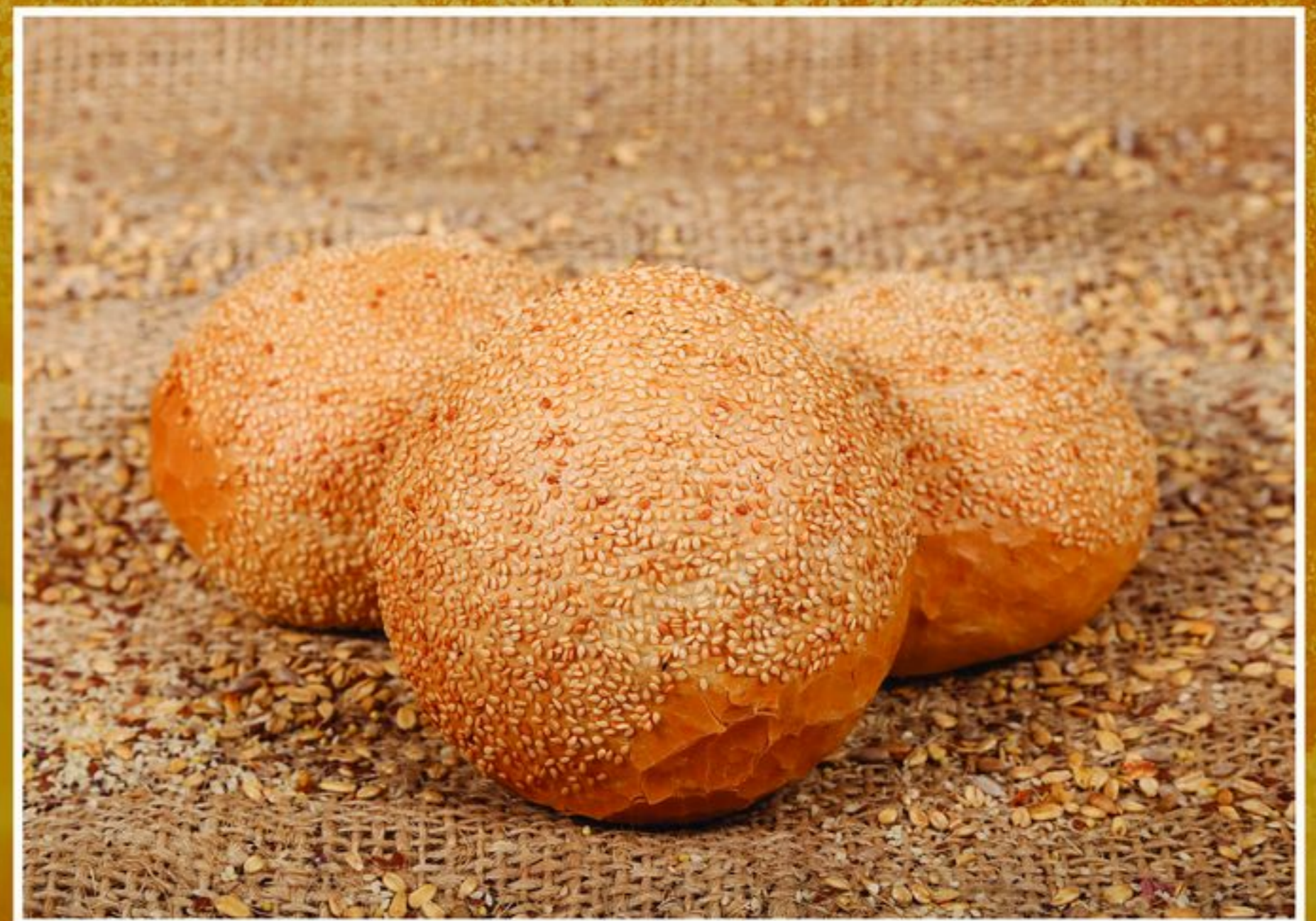
BUŁKA DO HAMBURGERA