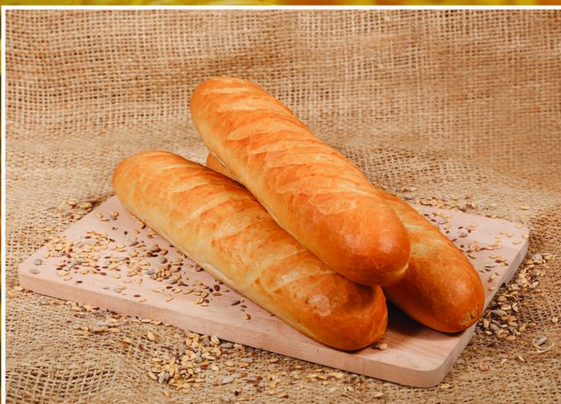
BUŁKA DO ZAPIEKANKI