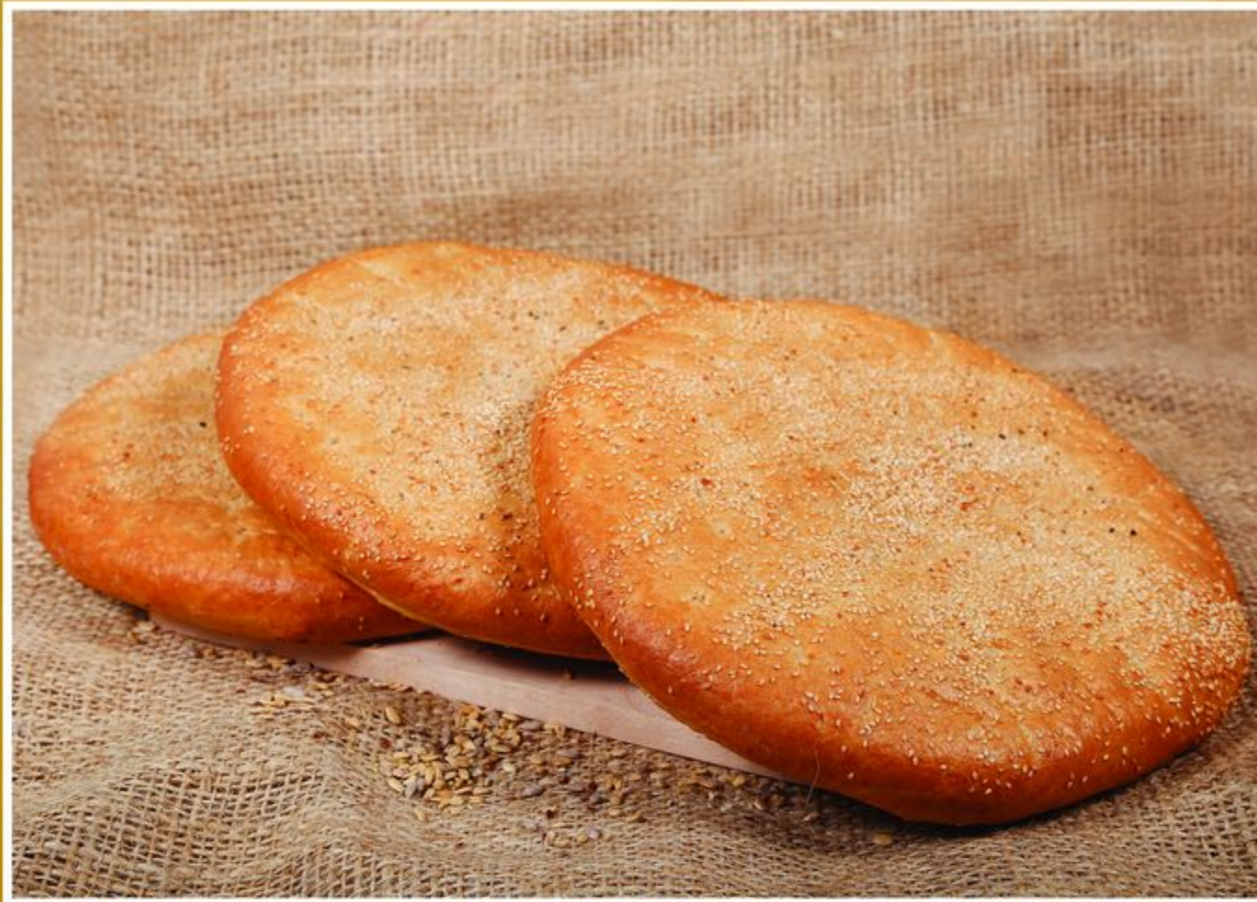
BUŁKA DO KEBABA