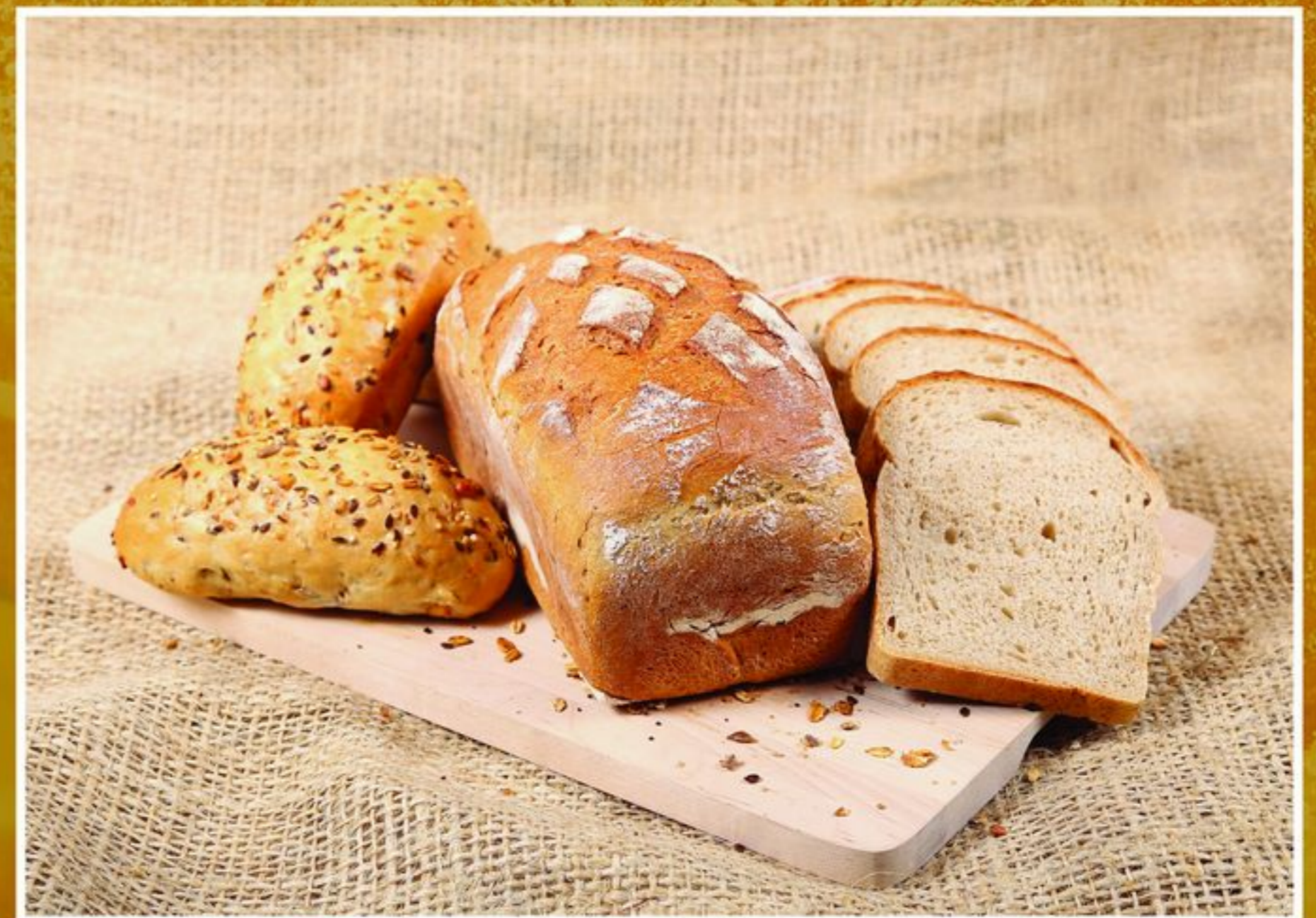
CHLEB ŻYTNI DOMOWY 0,45KG