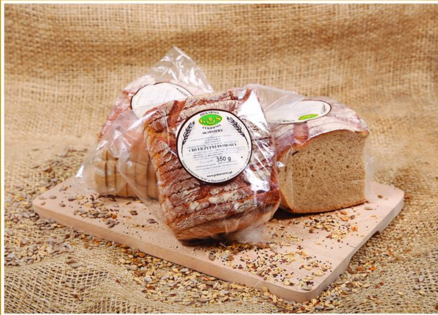
CHLEB ŻYTNI DOMOWY 0,35KG