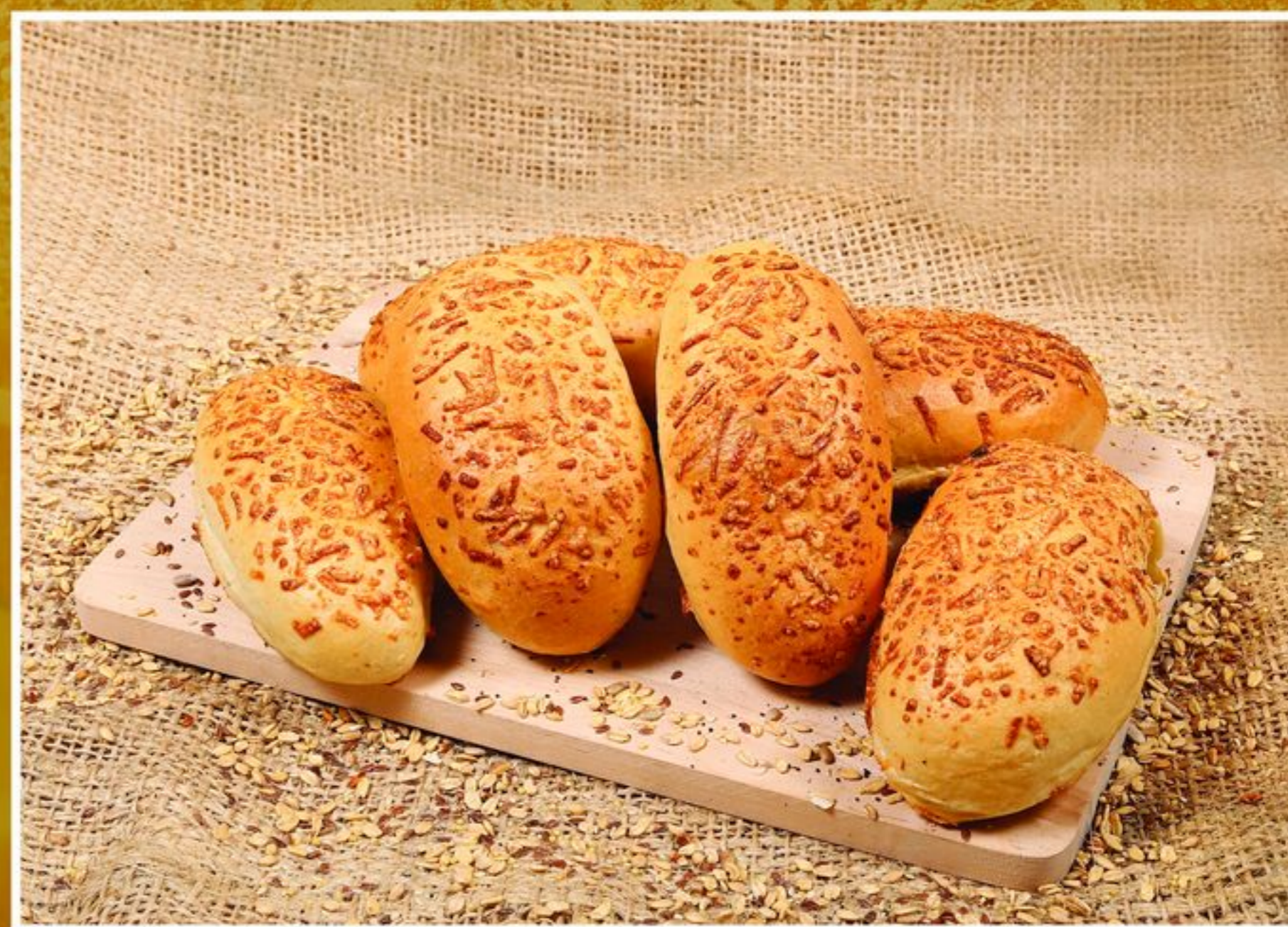
BUŁKA SZWEDKA Z SEREM