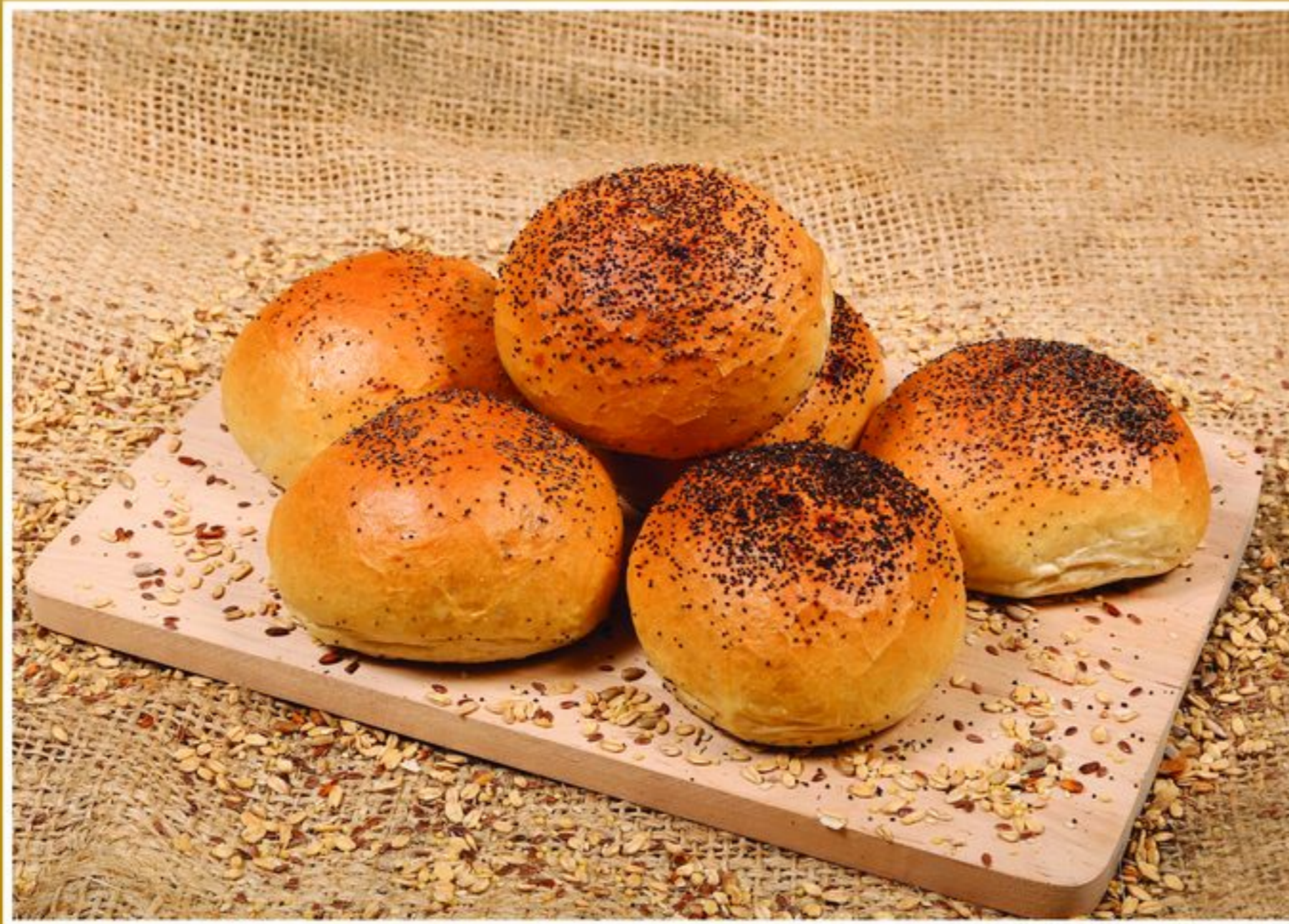
BUŁKA WROCŁAWSKA Z MAKIEM