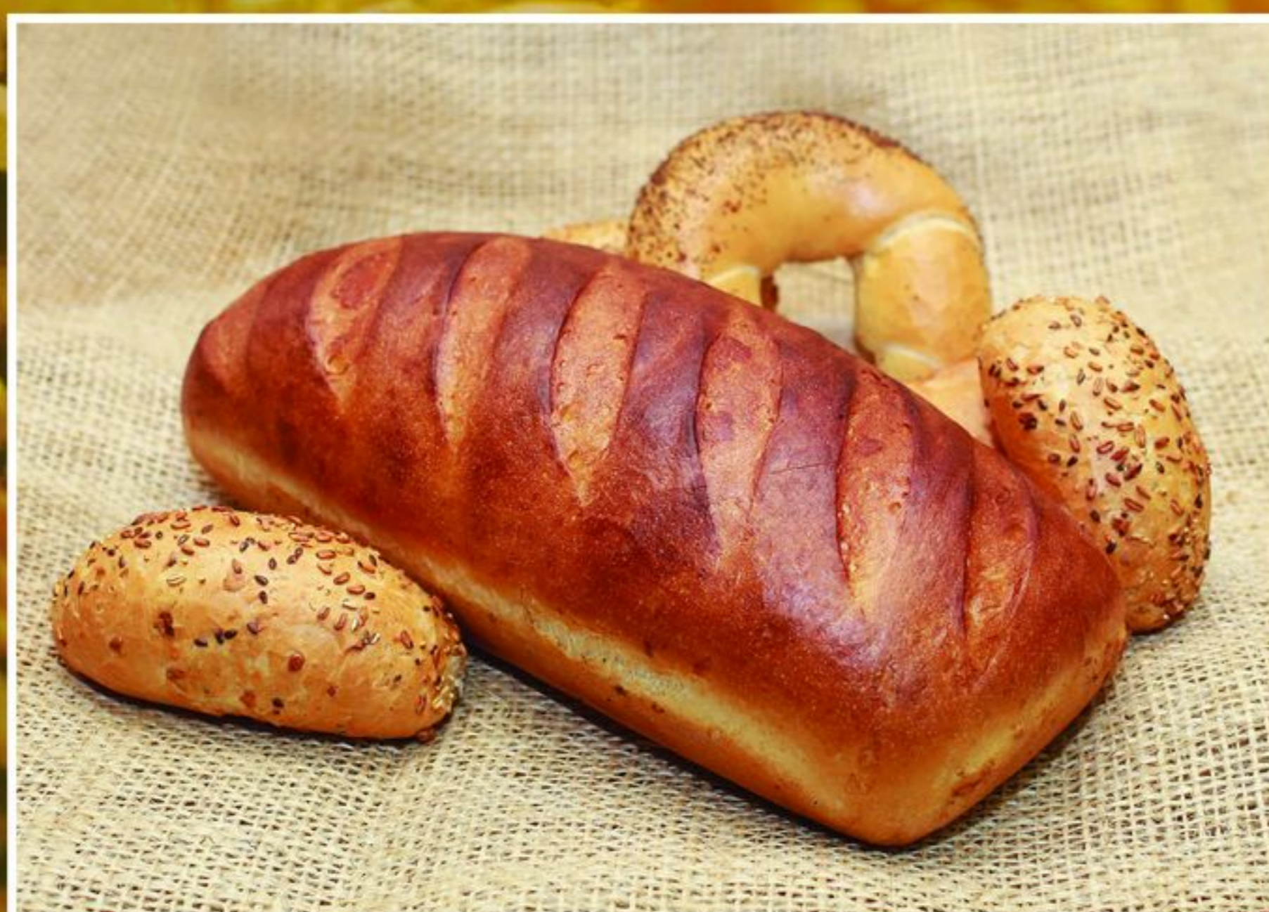
CHLEB OLIWSKI 1,10KG