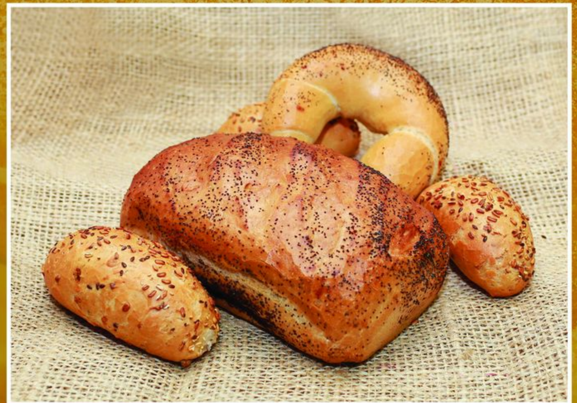
CHLEB ŻYTNI TRADYCYJNY