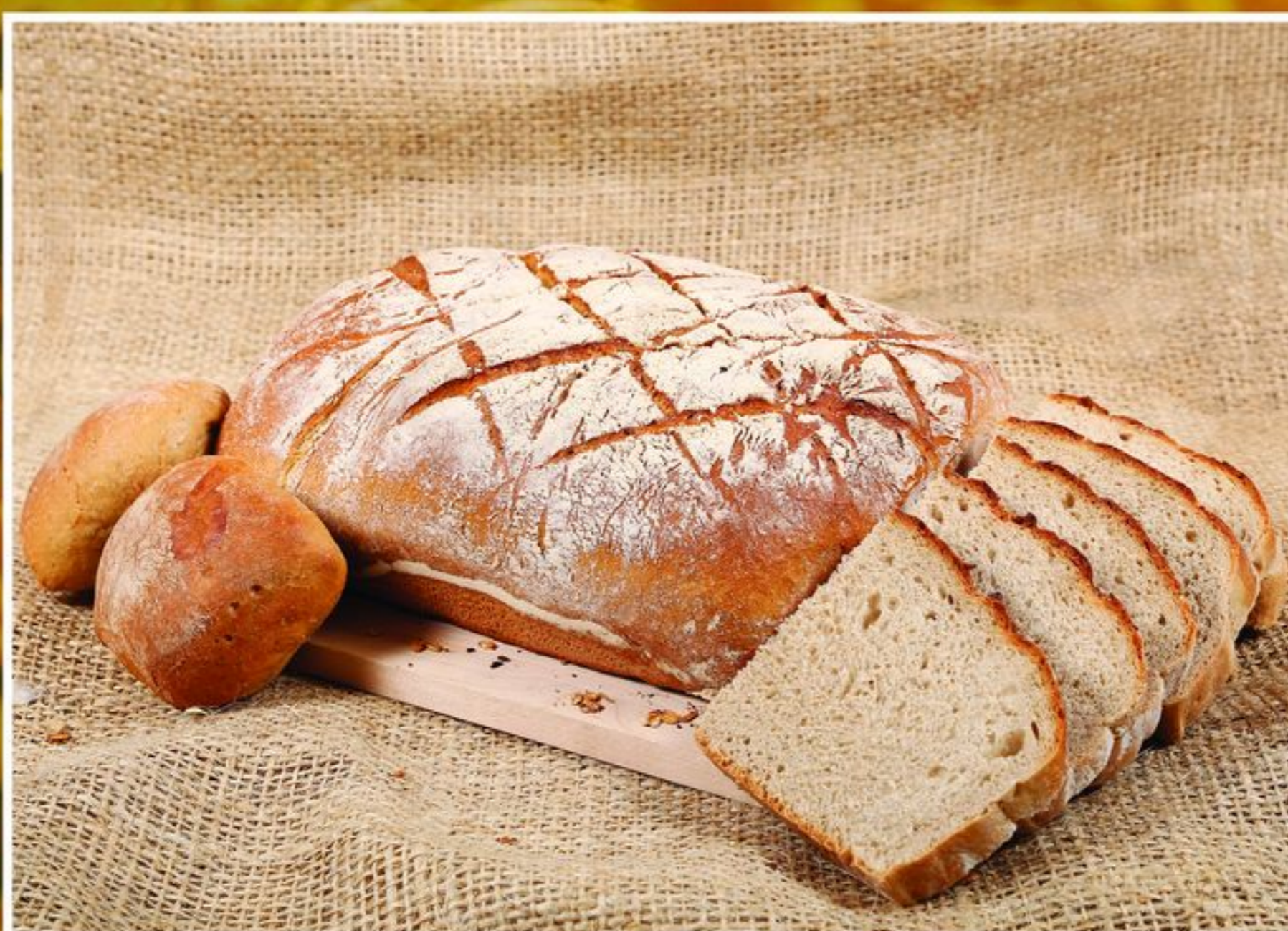
CHLEB ŻYTNI DOMOWY 1,40KG